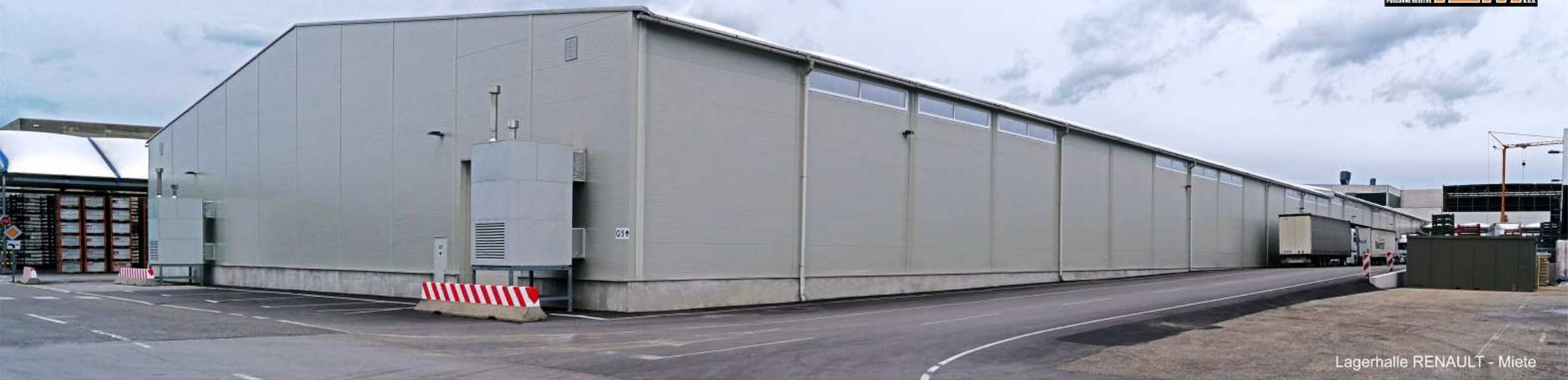
Lagerhalle RENAULT - Miete

Seit mehr als 20 Jahren bauen wir erfolgreich in und außerhalb von Europa. Die Erfahrungen die wir in dieser Zeit gesammelt haben sind die Basis unseres heutigen „Know-how“.